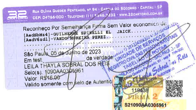
Vando Moreira Perez Secretário da Mesa

Registro Civil de Pessoa Jurídica Mogi Guaçu-SP Registrado e Microfilmado sob nº - 2 4 1 5 3 - 3 0 7 1 0 -